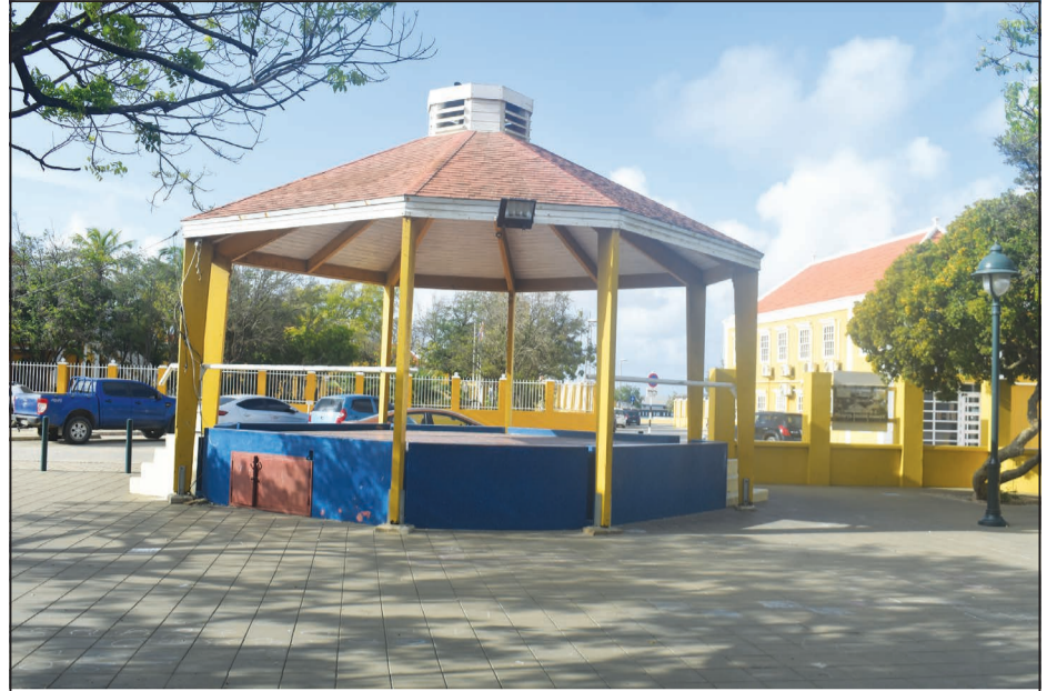
Kiosko nobo den Parke Wilhelmina.